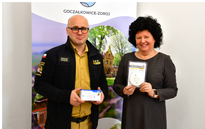
Czujniki trafiły do potrzebujących mieszkańców gminy