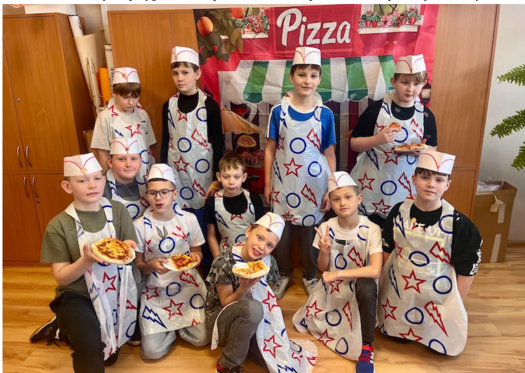
W szkole królowała pizza