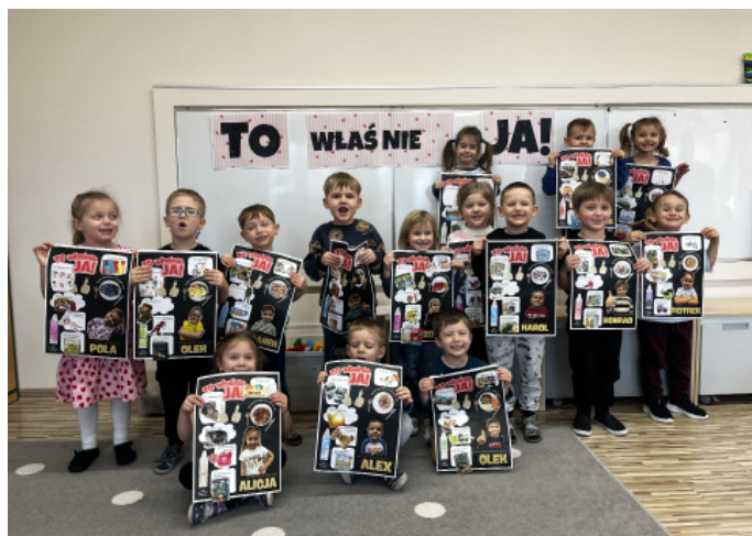
Projekt pokazuje, jak ważna jest samoakceptacja wśród dzieci

Samoakceptacja to nie fanaberia ani moda. To fundament zdrowego rozwoju. Dziecko, które potrafi powiedzieć „Lubię siebie” łatwiej przezwyciężać będzie napotkane trudności i znosić porażki. Takie dziecko nie będzie musiało szukać cudzej aprobaty za wszelką cenę, już od najmłodszych lat będzie stawiało granice i dbało o własną przestrzeń. W przedszkolu to szczególnie ważne, to tam dziecko uczy się jak funkcyj-