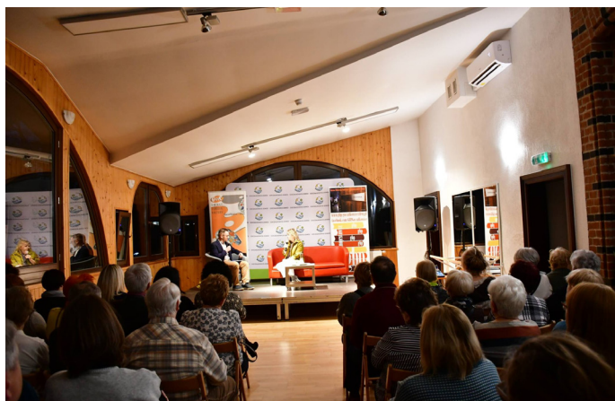
Spotkanie cieszyło się dużym zainteresowaniem

GMINNY OŚRODEK KULTURY W GOCZAŁKOWICACH - ZDRÓJU