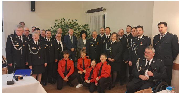
OSP ma zarząd na kolejną kadencję

- Gratuluję wybranemu zarządowi. Życzę wytrwałości w realizacji planów, liczę także na dalszą dobrą współpracę, bo bezpieczeństwo mieszkańców jest