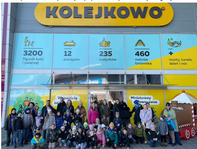
Gliwicka wystawa jest jedną z trzech jakie można zobaczyć w Polsce