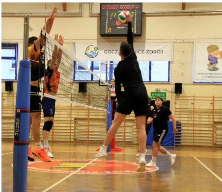
Liga wraca po niemal 10-letniej przerwie

Do rozgrywek zgłosiło się 12 drużyn. Ligowa rywalizacja rozpoczęła się od rundy zasadniczej w dwóch grupach po sześć zespołów: A i B. W wyniku losowa-