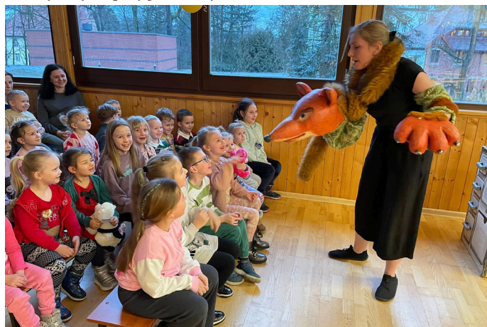
"Dobre rady Lisa Witalisa" to kolejna propozycja grupy O'Teatr