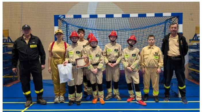
Reprezentacja MDP OSP podczas zawodów