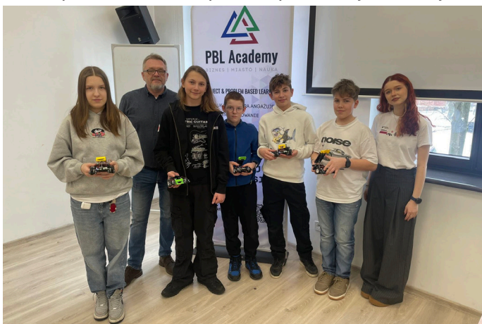
Warsztaty z AI i Robotami pokazały, że przyszłość należy do sztucznej inteligencji