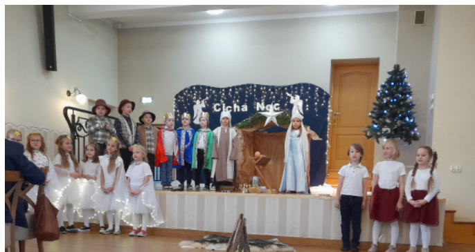
Dzieci przygotowały wspaniałe przedstawienie