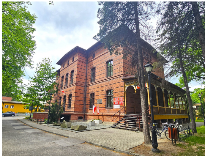
UG ▲ Przed nami prace w zabytkowym obiekcie (Fot. UG)

Celem programu „Ochrona zabytków” jest zachowanie materialnego dziedzictwa kulturowego poprzez konserwację i rewaloryzację zabytków nieruchomych i ruchomych oraz ich udostępnianie na cele publiczne.