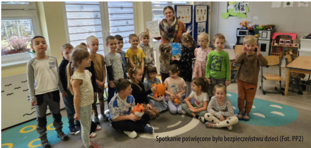
Spotkanie poświęcone było bezpieczeństwu dzieci