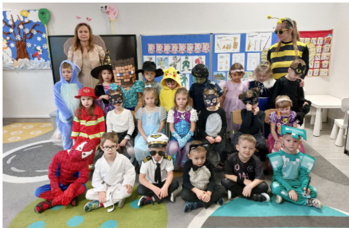
W balu udział wzięli ulubieni bohaterowie dzieci

Dzieci z niecierpliwością czekały na ten wyjątkowy dzień, w którym mogły zapre-