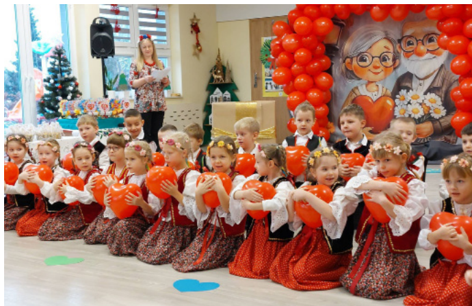
Przedszkolaki pięknie przygotowały się na to święto

Ostatnią grupą, która miała swój występ w piątek, 29 stycznia, była grupa „Sowy”. Dzieci z tej grupy były ubrane w przepiękne stroje ludowe i zaprezentowały bogaty program artystyczny. Na koniec zatańczyły poleczkę. Po każdym występie przedszkolaki zaśpiewały tradycyjne „Sto lat”, wręczyły swoim babciom i dziadkom upominki i laurki, poproszono