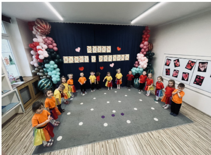
To było wielkie święto w przedszkolu

Każda uroczystość rozpoczęła się serdecznym powitaniem zaproszonych gości przez panią dyrektora. Następnie przedszkolaki mogły z dumą zaprezentować przygotowany z wielkim zaangażowaniem program artystyczny. Nie zabrakło piosenek, tańców czy wierszyków mówiących o tym, jak ważni dla naszych przedszkolaków są ich dziadkowie. Słowa kierowane do gości wywołały wzruszenie i uśmiechy na twarzach.