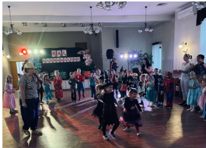
Co to był za bal!