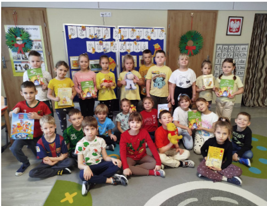
Dzieci poznały świat przyjaciół ze Stumilowego Lasu

U „Wiewiórek” można było doskonalić naukę liczenia miodku, przyczepić po omacku ogon Kłapouchemu, poruszać się pokonując przygotowany tor przeszkód oraz aktywnie bawić się na dywanie interaktywnym. W „Sowach” dzieci wysłuchały opowiadania pt. „Przyjaciele Kubusia Puchatka”. Zapoznaly się także z historią powstawania książki o sławnym misiu. Z masy sensorycznej z dodatkiem miodu ulepiły piękne Puchatki. Na pamiątkę dzieci otrzymały Kubusiowe opaski. Grupa „Pszczół-