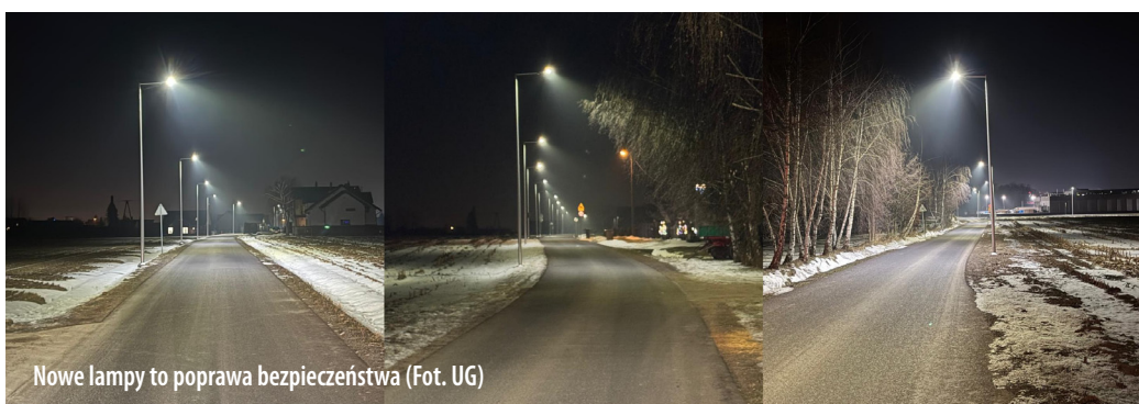
Nowe lampy to poprawa bezpieczeństwa

Przy ul. Robotniczej w Goczałkowicach-Zdroju zamontowanych zostało 30 słupów oświetleniowych wraz z nowoczesnymi oprawami oświetleniowymi LED.