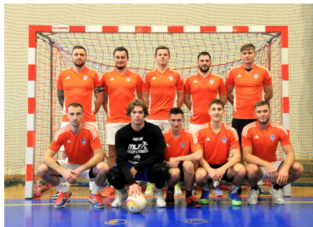
To były dobre zawody dla drużyny z Goczałkowic-Zdroju