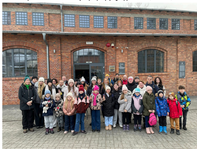
Sztolnia Królowej Luizy to obowiązkowy punkt na mapie Zabytków Techniki