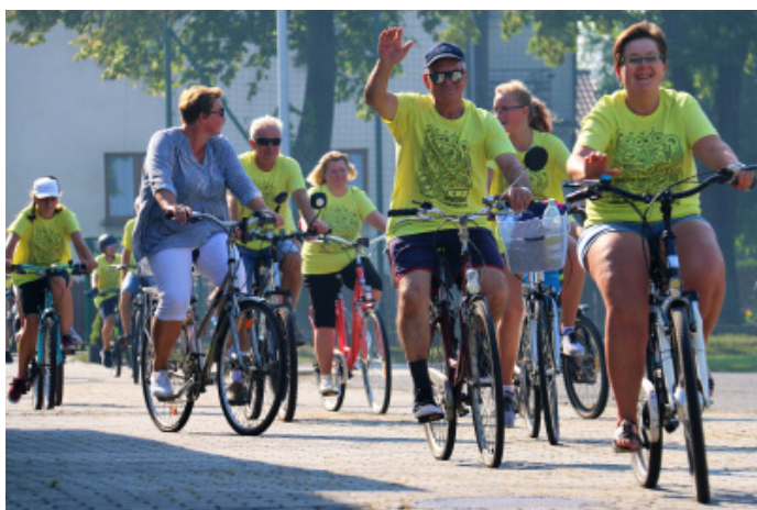
W imprezie udział wzięło blisko 250 osób.