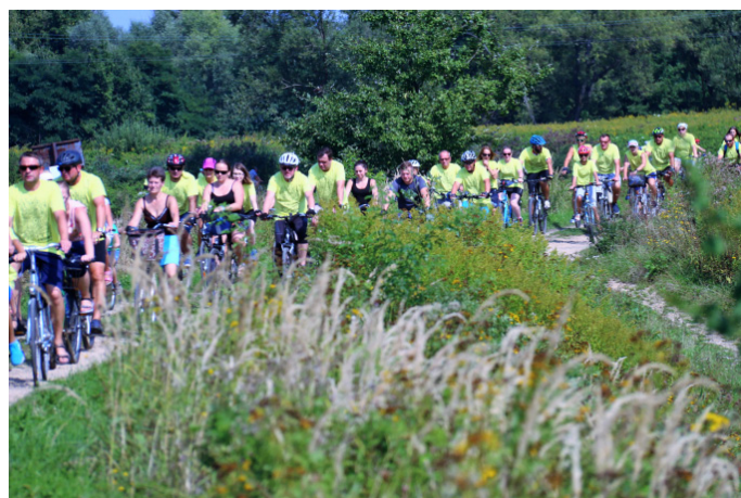
Uczestnicy pokonali trasę prowadzącą przez Goczałkowice i Łąkę.