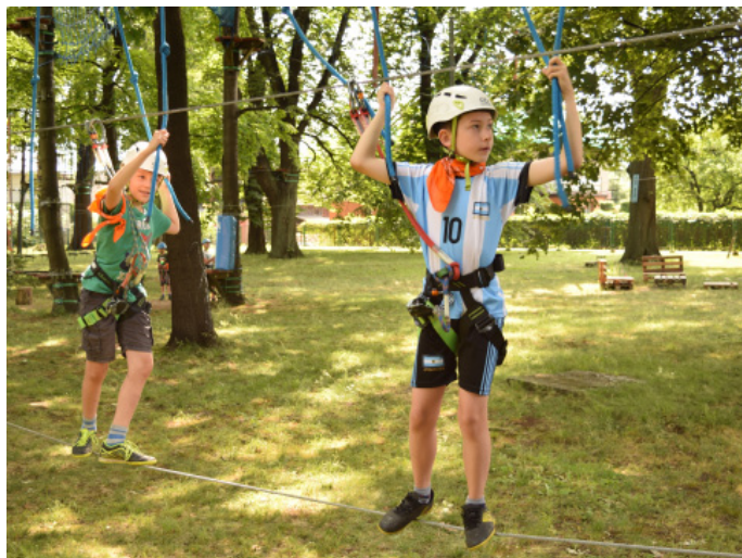
Dużym zainteresowaniem cieszyła się wizyta w parku linowym.