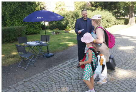
Podczas kampanii Śląskiego Urzędu Wojewódzkiego w Goczałkowicach.

Wnioski o przyznanie świadczenia na nowych zasadach można składać online