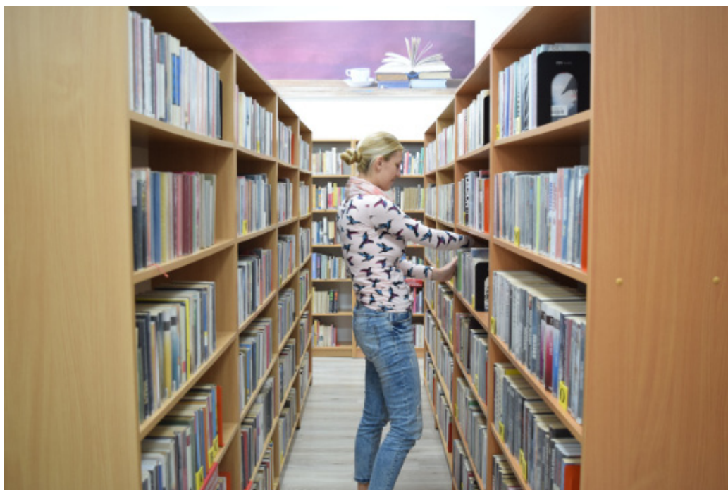
Goczałkowicka biblioteka ma na stanie ponad 15,5 tys. książek.

A czytelnicy w Goczałkowicach mają bardzo dobrze przystosowany obiekt. Biblioteka znajduje się w bowiem w odnowionych pomieszczeniach budynku „Górnik”. – Warunki dla czytelników są świetne, dział dziecięcy jest dostosowany do najmłodszych czytelników, jest kolorowo, przyjaźnie – zauważa A. Grzegorska. Zatem, zapraszamy!