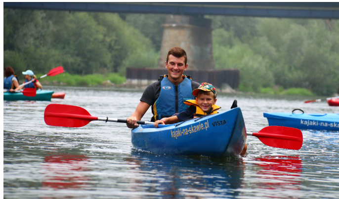
GOSiR Uczestnicy przepłynęli Skawą ponad 14-kilometrowy odcinek (Fot. GOSiR)

22-osobowa goczałkowicka grupa rozpoczęła spływ w Wadowicach. W sumie uczestnicy Skawą przepłynęli ponad 14-kilometrowy odcinek na odcinku Wadowice - Grodzisko. W organizowanym przez Gminny Ośrodek Sportu i Rekreacji w Goczałkowicach-Zdroju wyjeździe rodzinnym wzięli udział: dzieci, młodzież i osoby dorosłe. Dla większości uczestników spływ kajakowy na Skawie był pierwszym takim doświadczeniem w życiu, ale mimo to trudy z nim związane pokonali perfekcyjnie. Uśmiech na twarzach uczestników na mecie świadczył, że spływ dostarczył wielu wrażeń oraz satysfakcji. Wycieczka rodzinna odbyła się w ramach akcji „Goczałkowickie Wakacje 2019”.