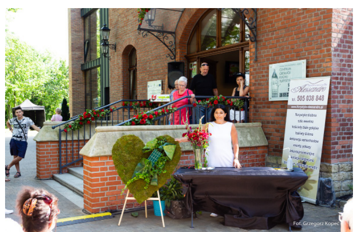
Pokaz florystyczny w wykonaniu Atelier Florystyczne Alessandro.

przy Starym Dworcu podziwiać można było imponujące aranżacje świetlne. Na trasie Gwarek-Stary Dworzec bezpłatnie kursował różany melex, dla dzieci przygotowano dmuchańce. Wszyscy mogli spróbować też