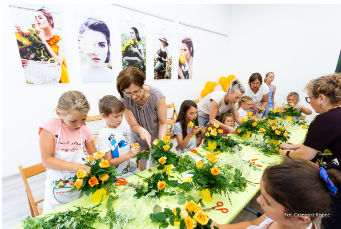
Dla dzieci przygotowano warsztaty florystyczne.