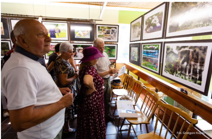
Stowarzyszenie „Przeciw Nicości” zaprezentowało wystawę „W ogrodzie wyobraźni”.