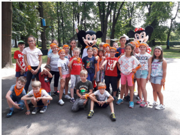
Uczestników półkolonii odwiedzili Myszka Mickey oraz Minnie.

bibliotecznych, z robotyki Lego, dogoterapii, profilaktycznych związanych z profilaktyką uzależnień. Uczestnicy półkolonii odwiedzili także Stary Dworzec – pierwszy turnus podziwiał tam wystawę róż, a drugi – wystawę malarstwa.