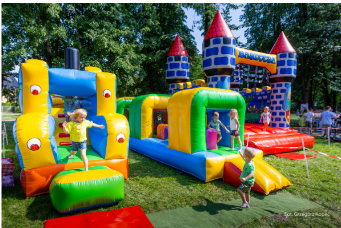
Tradycyjnie nie zabrakło atrakcji dla najmłodszych!