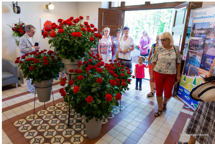
Przez cały weekend na Starym Dworcu można było podziwiać piękne wystawy kwiatów.

Róże nie przez przypadek są bohaterkami tej niezwykle imprezy organizowanej zawsze na początku lipca przez Gminny