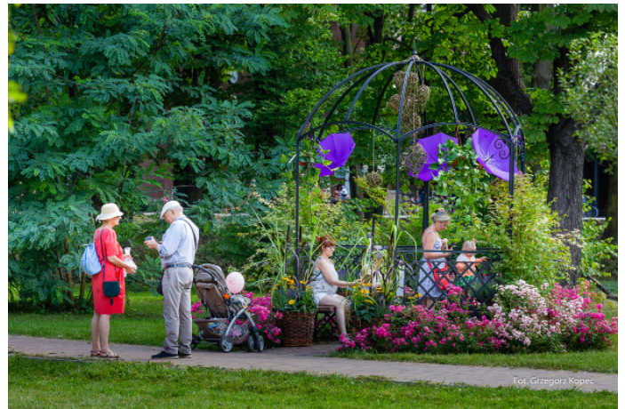
Wspaniale zaaranżowane zostały altanki w Parku Zdrojowym.