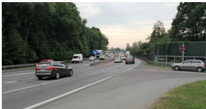
Władze gminy Goczałkowice-Zdrój po raz kolejny zwracają uwagę na konieczność poprawy bezpieczeństwa na DK1

Przedstawiciele Urzędu Gminy Goczałkowice-Zdrój zwrócili uwagę na konieczność poprawy