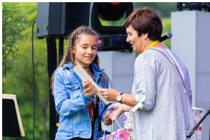
Nagrodzono też uczestników konkursu plastycznego.