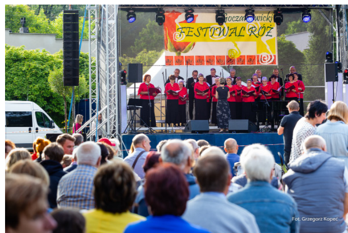
Tradycyjnie podczas Festiwalu Róż nie mogło zabraknąć przeglądu chórów.