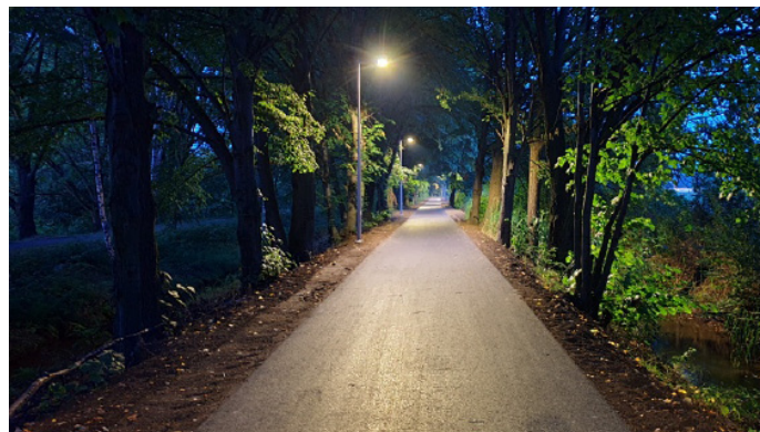
Przebudowa drogi kosztowała prawie 1,7 mln zł.

– Przebudowa znacznie poprawiła komfort, a także bezpieczeństwo poruszających się