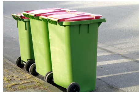
Nowa umowa na odbiór odpadów w gminie będzie obowiązywała od 1 stycznia 2020.

„Rozwiązanie problemu wadliwego, w opinii wielu fachowców, systemu gospodarki odpadami w naszym kraju, nie należy do zadań łatwych. Samorządowcy skupieni w ramach Śląskiego Związku Gmin i Powiatów są jednak zgodni, iż w procesie tym, ustawowo