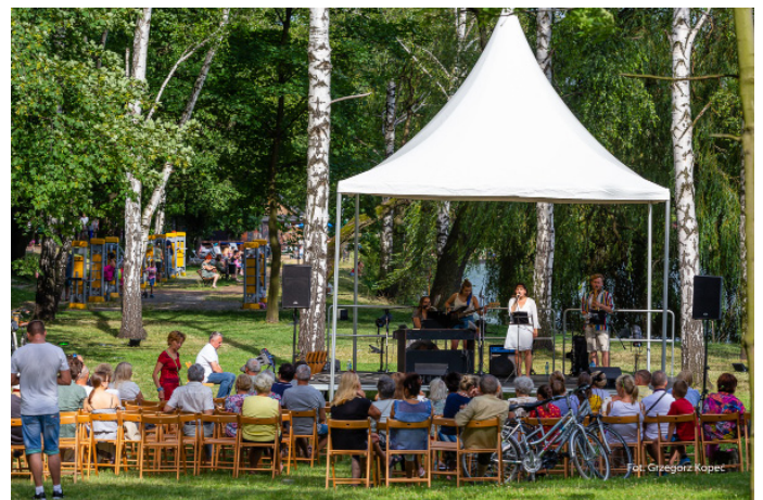
Sobotnie popołudnie wypełniła seria koncertów przy Starym Dworcu.