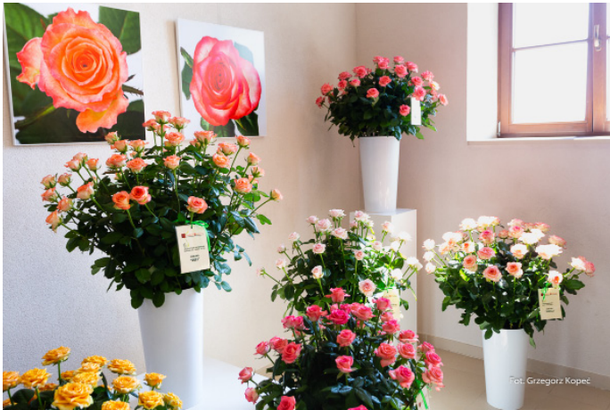
Podczas imprezy królowały róże czerwone, ale były także te w innych odcieniach.