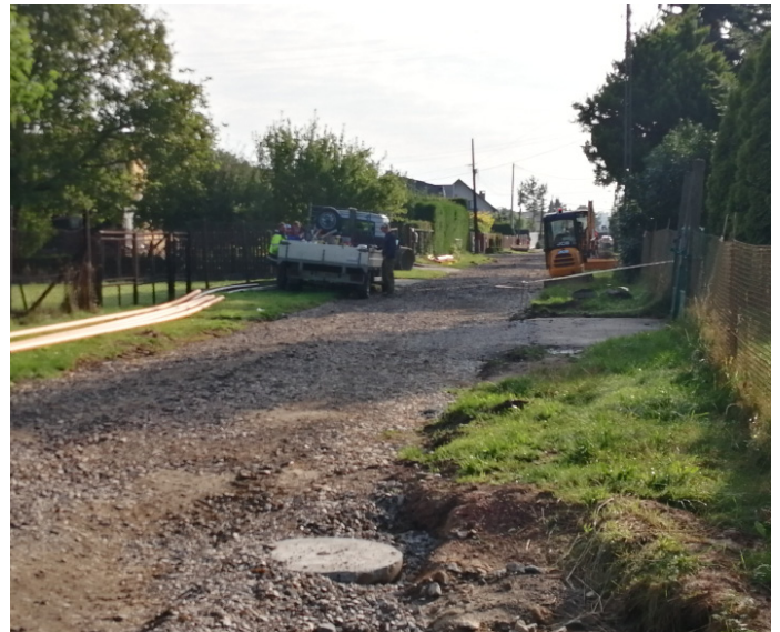
Ul. Sołecka zostanie przebudowana na długości prawie 500 mb.

Zakres prac na ul. Solankowej obejmuje natomiast przebudowę drogi na długości ok. 280 mb, o szerokości jezdni 5 mb, a także przebudowę odcinka ul. Rolnej na długości ok. 90 metrów, w tym wykonanie nowej nawierzchni z asfaltobetonu oraz wymianę warstw konstrukcyjnych, wymianę obustronnie krawężników wzdłuż jezdni oraz przebudowę zjazdów indywidualnych do posesji. W ramach zadania wybudowany zostanie kolektor kanalizacji deszczowej na długości 145 mb oraz 74 mb kanalizacji wraz z zabudową studni rewizyjnych oraz wypu-