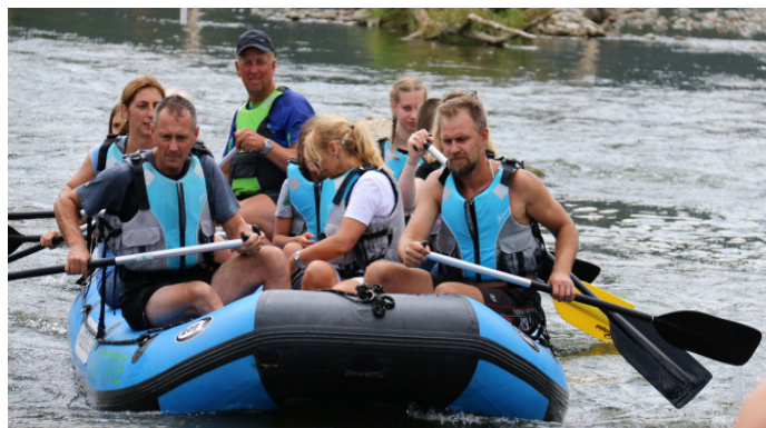
GOSiR W wycieczce wzięło udział 47 osób

W drogę powrotną uczestnicy wycieczki udali się na rowerach, poruszając się Drogą Pienińską, która jest równoległa do Dunajca, a ze Sromowiec ponownie autokarem wrócili do Goczałkowic-Zdroju.