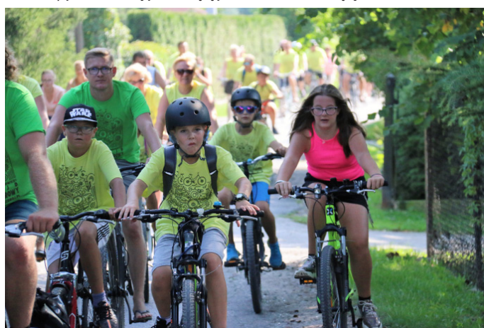
Dla młodszych rowerzystów 20-km trasa nie stanowiła żadnego problemu.