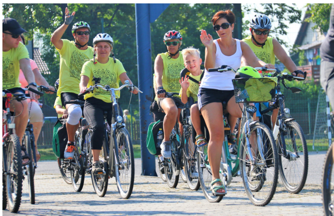
Nastroje były wysmienione, bo słoneczna niedziela na rowerach to sama przyjemność.