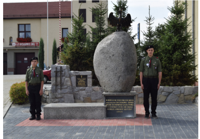
Tablica upamiętniająca poległych powstańców z Goczałkowic znajduje się przy ul. Szkolnej.