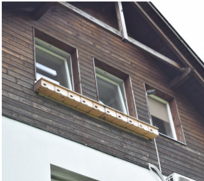
Budki dla jerzyków na budynku probostwa.

Pięć lat temu zamontował pierwsze budki na budynku probostwa. Samo to jednak niewiele daje, bo jerzyki trzeba jeszcze do nich ściągnąć. Jak opowiada proboszcz, na początku przylatują swego rodzaju „zwiadowcy”, którzy sprawdzają, czy miejsce, w którym rodzina bytowała rok wcześniej są wolne. Jeśli są, rodzina wraca do starego miejsca lęgowego. Jeśli jerzyk nie znajdzie miejsc gniazdowania, w których był rok wcześniej i musi szukać nowych, bardzo się stresuje. To tak wielki