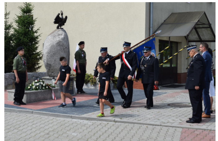
W uroczystości udział wzięli też m.in. harcerze oraz przedstawiciele OSP.