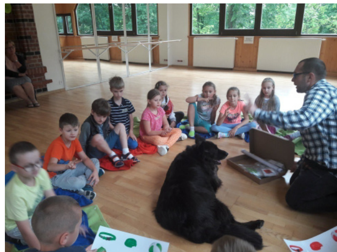
Dzieci wzięły udział m.in. w zajęciach z dogoterapii.