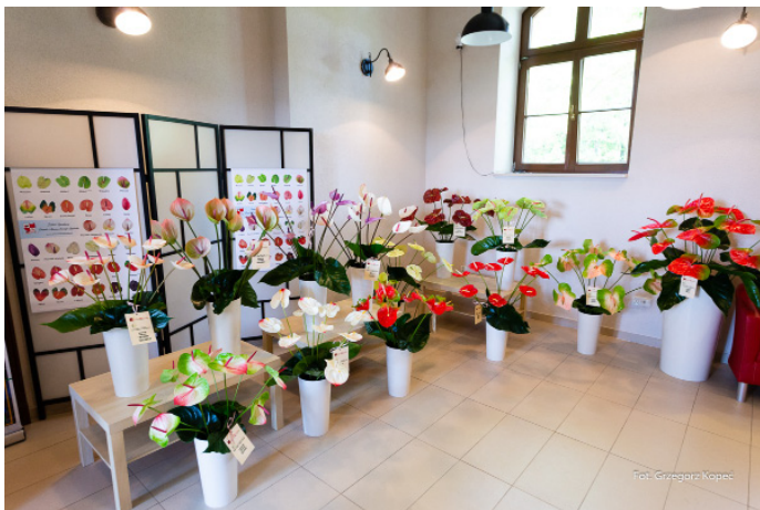
Goczałkowickie gospodarstwa ogrodnicze zaprezentowały również 19 odmian anturium.