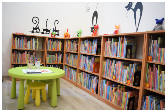
W placówce jest specjalny dział dla najmłodszych czytelników.

W goczałkowickiej bibliotece książki zdecydowanie chętniej wypożyczają panie niż panowie. Z placówki korzystają też kuracjusze uzdrowiska. W 2018 roku najliczniejszą grupę czytelników stanowiły osoby w wieku 25-44 lat, drugą najliczniejszą – osoby w wieku 45-60 lat, a trzecią – powyżej 60 lat. Do biblioteki często przychodzą też dzieci korzy-