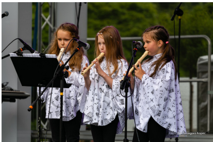
W niedzielę na scenie w parku odbyły się prezentacje muzyczne dzieci i młodzieży.