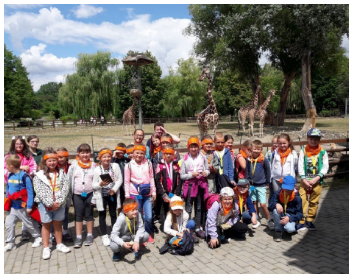
Podczas wycieczki do zoo w Chorzowie.

Każdego dnia przygotowano inne zajęcia, więc nikt nie mógł narzekać na nudę. W ramach obu turnusów odbyły się wycieczki do zoo w Chorzowie, Parku Rozrywki w Krasiejowie, do kina. Dzieci wzięły też udział m.in. w zajęciach plastycznych,