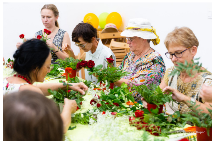
Ciekawe kompozycje kwiatowe pod okiem specjalisty mogli tworzyć też dorośli.