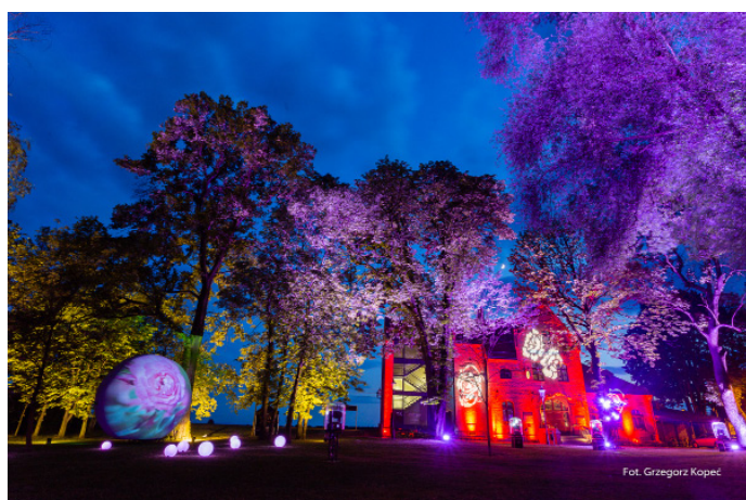
Po zmroku zachwycały aranżacje świetlne przy Starym Dworcu.